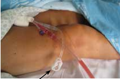
Leiding voor het spoelen

In uitzonderlijke situaties kan het zijn dat het systeem ontkoppeld moet worden om met een grote spuit te spoelen en op die manier bloed en weefselresten te verwijderen.