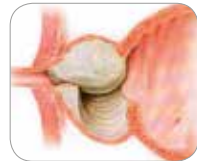
Schematische weergave waarbij een deel van de prostaat weggehaald is