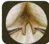
Endoscopisch beeld na het weghalen van een deel van de prostaat