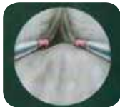
Endoscopisch beeld van het begin van de prostaatresectie

Daarna zal de chirurg via de urinebuis een hol instrument tot aan de prostaat brengen. Hierlangs kan de arts de prostaat bekijken en andere instrumenten inbrengen om de prostaat te behandelen. De prostaat wordt afgeschraapt, vergelijkbaar met het uithollen van een appel vanuit het klokhuis, waarbij enkel de schil overblijft.