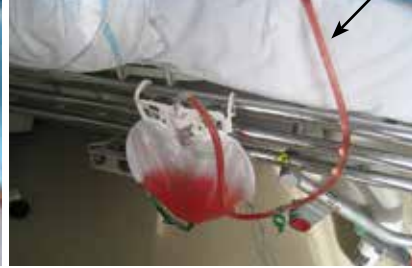
Leiding waarlangs de urine en spoelvloeistof afvloeien