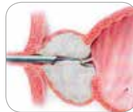
Schematische weergave met de prostaat in grijs