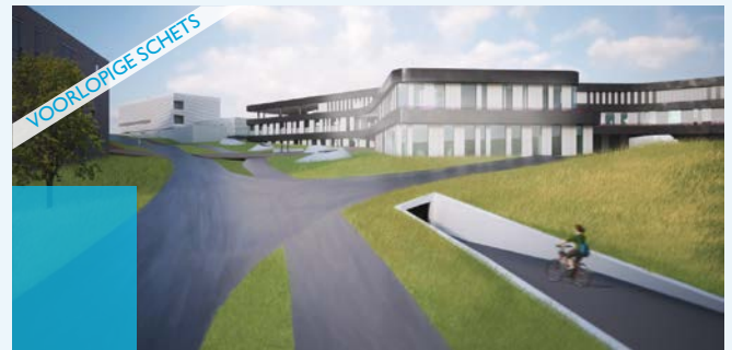
Zicht vanaf de ringweg op het nieuwe logistieke centrum. Links van de weg liggen de KHLeuven en onderwijs & navorsing 2.

van goederen en ons eigen containerpark. Daarnaast voorziet de KU Leuven op die locatie in een parkeergebouw voor 360 wagens en een ondergrondse fietsenkelder voor 2 500 fietsen.