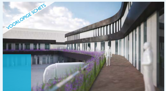
De gevel krijgt banden van zwart metaal, waartussen glas en vezelcement elkaar afwisselen.

Na een ontwerpwedstrijd werd gekozen voor een ontwerp met een vloeiende vorm, waarin alle onderdelen een duidelijke en herkenbare plaats krijgen. Het gebouw komt langs de ringweg in de berm te liggen en zal de vorm van het landschap volgen. Zo wordt geprofiteerd van de hoogteverschillen in de berm en wordt de leverplaats voor vrachtverkeer aan het zicht onttrokken.