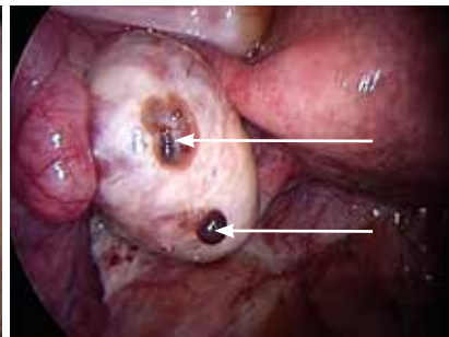
endometrioseletsels op de eierstok