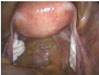
normale buikholte met baarmoeder, eierstokken, eileiders

Endometriose kan, als het niet behandeld wordt, ook leiden tot onvruchtbaarheid.