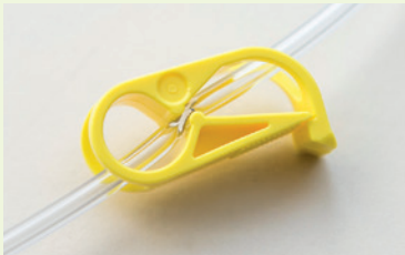
Le tube est fermé par le clamp.