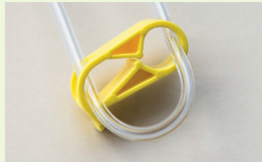
Le tube n'est pas fermé par le clamp.